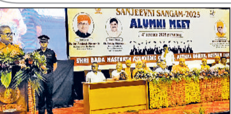
रोहतक। बाबा मस्तनाथ विश्वविद्यालय में आयोजित श्री बाबा मस्तनाथ आयुर्वेद कॉलेज में पूर्व छात्रों का भव्य मिलन समारोह को संबोधित करते सिक्किम के राज्यपाल ओमप्रकाश माथुर।