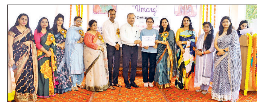
रोहतक। सर छोटाराम कन्या महाविद्यालय में आयोजित प्रतियोगिता के प्रतिभागियों को सम्मानित करते आयोजक।

रोहतक। कार्यक्रम में मौजूद अतिथि व आयोजक।